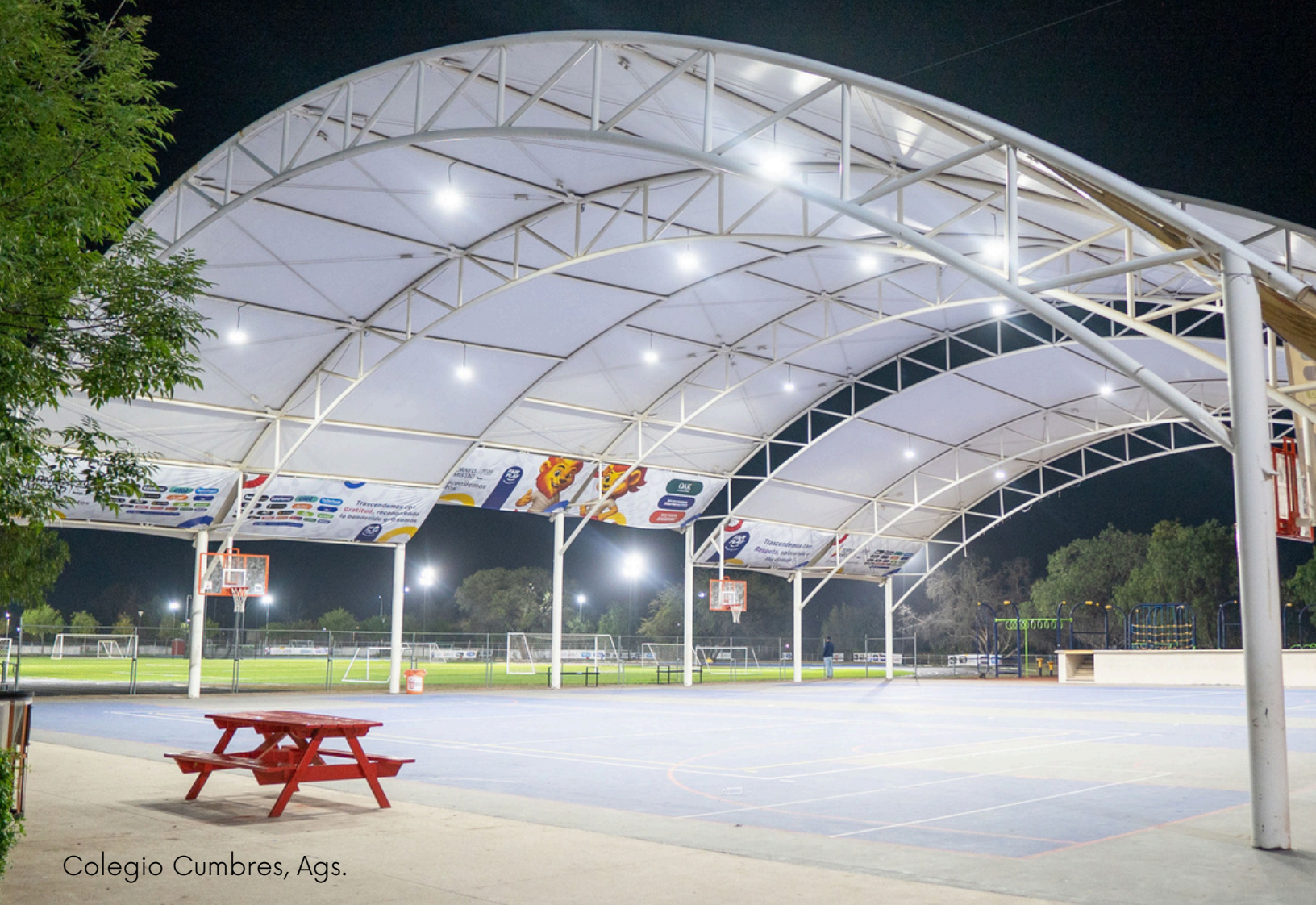
Colegio Cumbres, Ags.