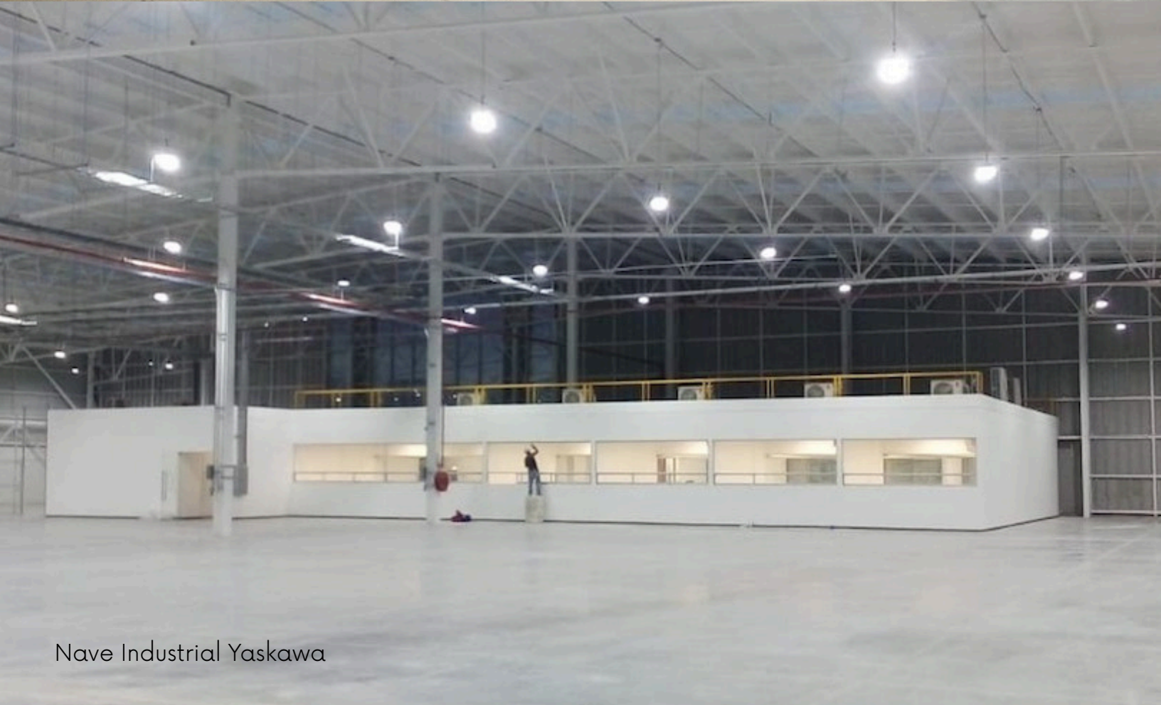
Nave Industrial Yaskawa