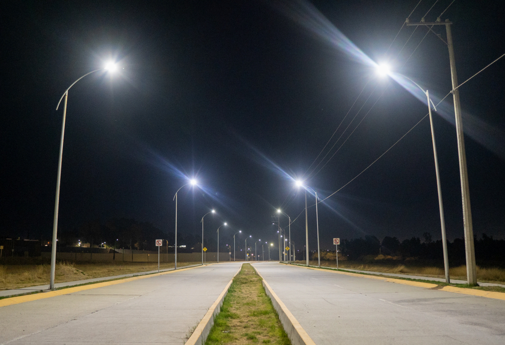
Alumbrado público de fraccionamiento