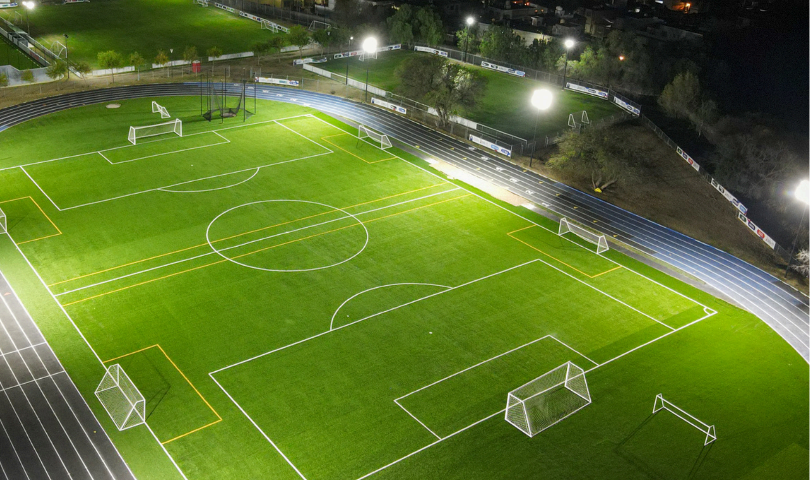
Colegio Cumbres, Ags.