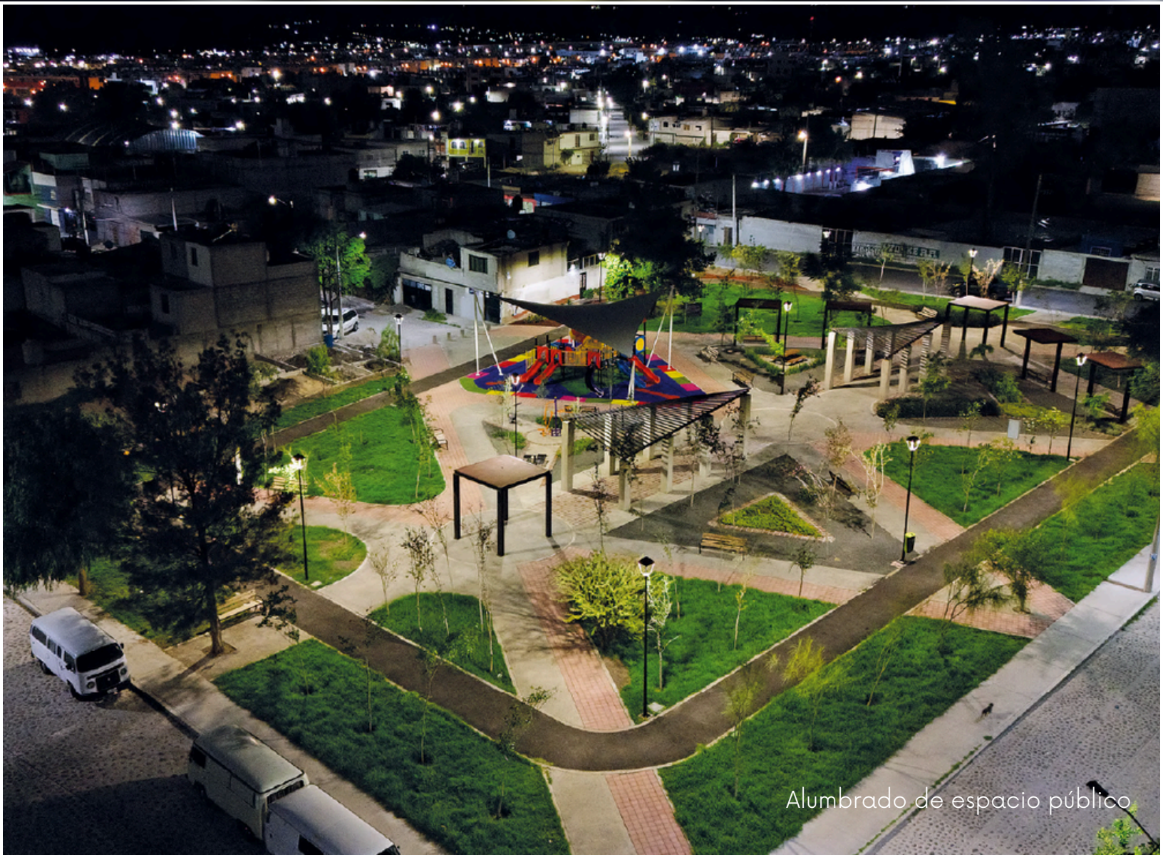
Alumbrado de espacio público